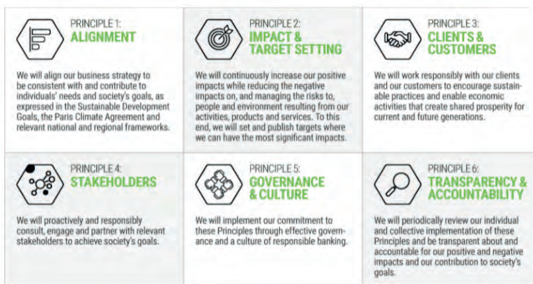
Figur 1 Oversikt over de seks prinsippene for bærekraftig bankdrift. Hentet fra https://www.unepfi.org/banking/bankingprinciples/

UNEP FI er FNs miljøprogramms finansielle initiativ som er et internasjonalt samarbeid for finanssektoren. Initiativet for banker inkluderer seks prinsipper for bærekraftig bankdrift. 1