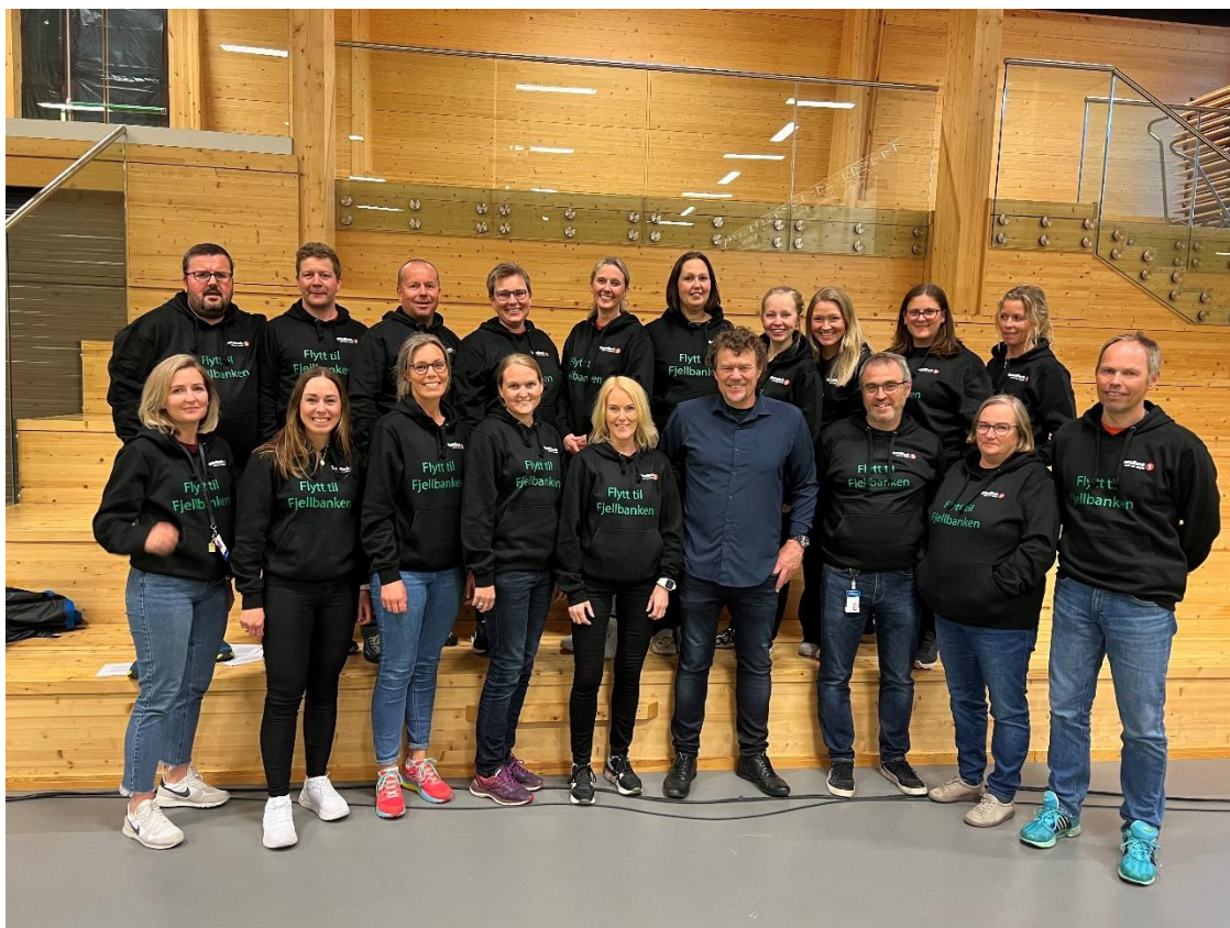
Tilsette i Fjellbanken saman med Lars Monsen på kundekveld i Utgard

solid lokalbank og ein aktiv samfunnsaktør i Nord-Gudbrandsdalen.