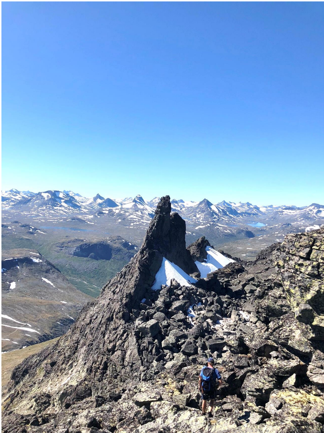
Søre Nål på Knutseggje