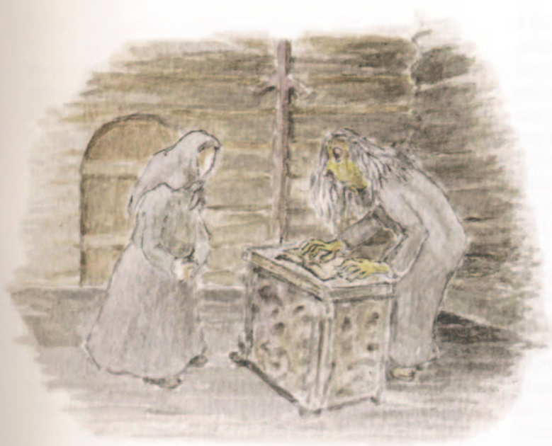
Illustrasjon: Styggen sjølv og ei trollkjerring i kyrkja Jonssoknatta