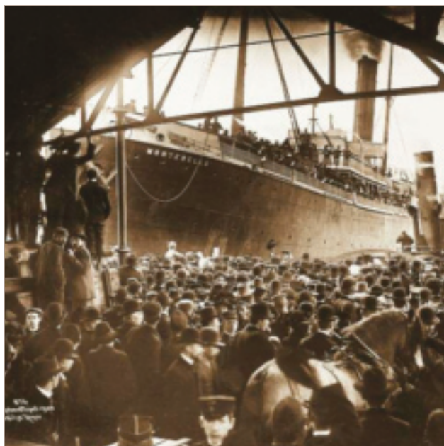
Oppstartingsåra for banken fall saman med den store utvandringa til Amerika. Det er to ulike måtar å sjå utvandringa på i høve til banksoga. Den eine er at bygdesamfunnet vart tappa for oppspart kapital og store menneskelege verdjar. Omvendt kan ein leggje vekt på at utvandringa gjorde at det vart så stort folketal å brøfø på små åkerlappar. På bildet blir det gjort klart for at emigrantskipet Montebello skal leggje frå kai i Bjørvika i 1903.

Men det skjedde meir og på mange måtar større endringar samstundes. Kan hende det aller viktigaste var at folk tok til å rømme bygdene i strie straumar. Dei fór til byen og fann seg arbeid der. Mange reiste vidare til Amerika, eller dei reiste direkte utan byen som mellomstasjon. 1 Etter kvart gjekk den strie straumen direkte frå bygda til Amerika. Folketalet byrja å gå ned. Ikkje berre det.