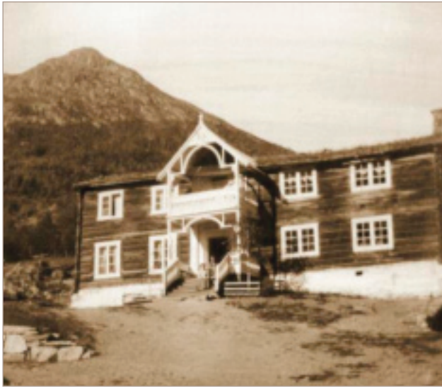
Den gamle bygningen på garden Andvord der Lom og Skjåk Sparebank starta opp bankverksemda den 2. januar 1874. Den nørde delen i fyrste etasje kan vere oppført så tidleg som på 1600-talet.

Trass i at sparebankane oppstod i Tyskland, var det Storbritannia som skapte industrialiseringa og det moderne pengesamfunnet som la grunnlaget for eit bankvesen til nytte for folk flest. Presten Duncan vil ha sin plass i historia som spareideolog, sjølv om han ikkje var fyrst ute med sparebanken sin. Som spareideolog sette han opp desse grunnsetningane for bankdrift: