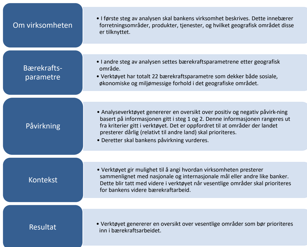
Figur 2: Stegene i påvirkningsanalysen som er gjennomført.

Ved signering av prinsippene har SpareBank 1 Østlandet forpliktet seg til å gjennomføre en påvirkningsanalyse. En slik analyse viser hvor banken har positiv og negativ påvirkning på ulike bærekraftstemaer. For gjennomføring av analysen benyttes analyseverktøyet Portfolio Impact Analysis Tool for Banks 4 utviklet av UNEP FI i samarbeid med bankene. Oppbyggingen av analysen steg for steg kan ses i Figur 2. Analysen baserer seg på verktøyet og integrerte veiledninger.