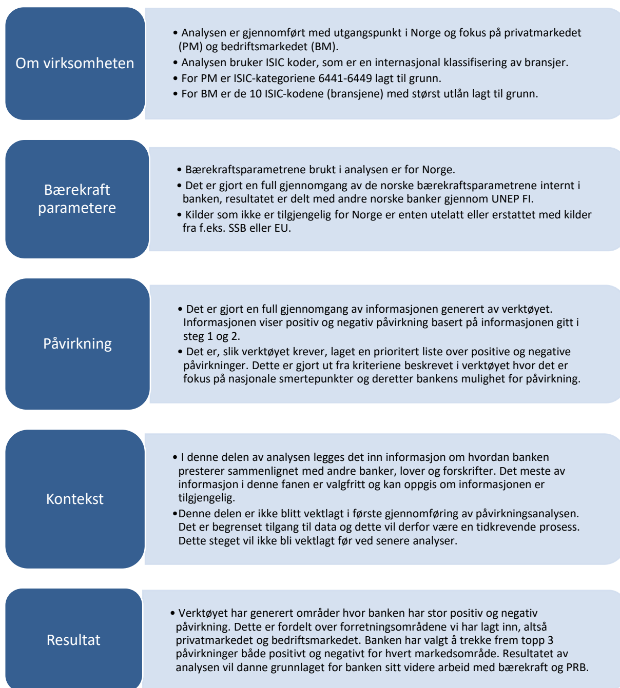
Figur 3: Grunnlaget for SpareBank 1 Østlandet sin påvirkningsanalyse.