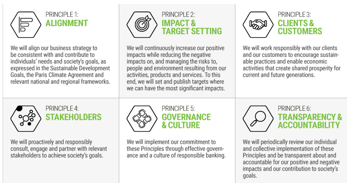
Figur 1: Oversikt over prinsippene for ansvarlig bankvirksomhet.

SpareBank 1 Østlandet ønsker å bidra i banknæringen sin globale bærekraftdugnad. FNs miljøprogram (UNEP) har et partnerskap med finanssektoren – Finance Initiative (UNEP FI). I september 2019 ble The Principles for Responsible Banking offisielt lansert av UNEP FI. Bankene som signerer prinsippene forplikter seg til å følge de 6 prinsippene vist i Figur 1. SpareBank 1 Østlandet var den første norske banken til å signere prinsippene. Målet er at banker verden over skal ta en pådriverrolle i arbeidet med å nå FNs bærekraftsmål og oppfylle forpliktelsene i Parisavtalen.