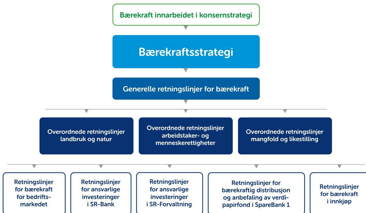
Figuren viser hvordan styringsdokumentene er innarbeidet i konsernet.