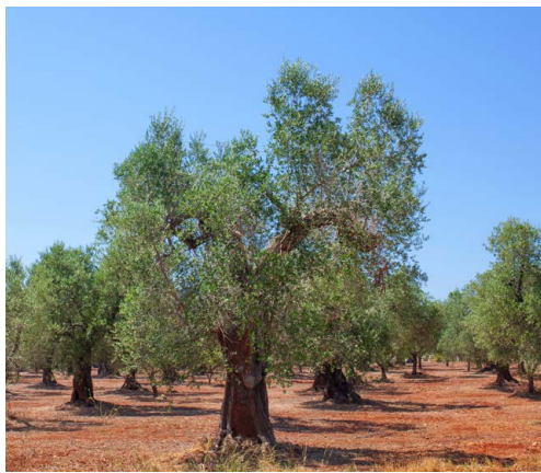
Gamle og mektige oliventrær