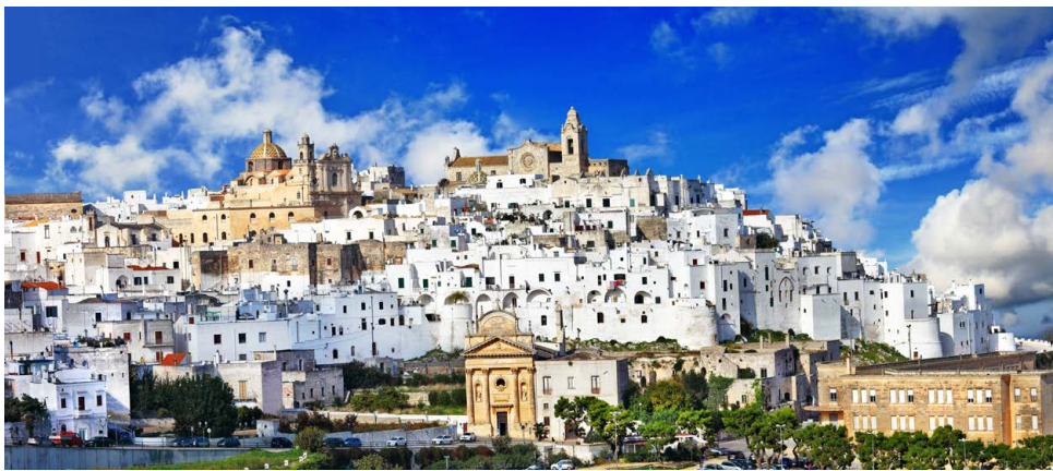
Greske vibber med hvitt og blått