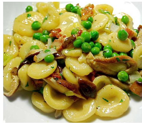
Orecchiette - lokal spesialitet

Puglia er en av Italias best bevarte hemmeligheter! Tusener av nordmenn drar hvert år til Italia, men de færreste har kommet lenger sør enn Roma eller kanskje Napoli og Sorrento. Selv for mange nord-italienere slutter landet ved hovedstaden. Det de går glipp av, er en landsdel med en rik kultur og historie, byer med storslått arkitektur og vakre landsbyer på rad og rekke. Her i sør venter en solfylt region, kystlinje til to hav som veksler mellom ville klipper og hvite sandstrender, og frodig landskap med endeløse sølvgrå olivenlunder, mandelplantasjer og hvitkalkede landsbyer med sine særpregede runde «trulli-hus». Her produseres 80% av Italias pasta og olivenolje, det dyrkes tomater, fikener, fennikel og melon. Lokale bønder lager mozzarella på gammelt vis, og ikke å forglemme vingårdene der utmerkede rødviner lages av primitivo-druen. Alt ligger altså til rette for en deilig ferie med sol, fine opplevelser og nydelig mat og drikke. Kom og vær blant de første til å oppleve denne nydelige regionen i Italia!