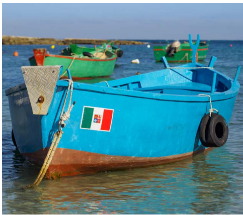
Vanlig fotomotiv i Puglia